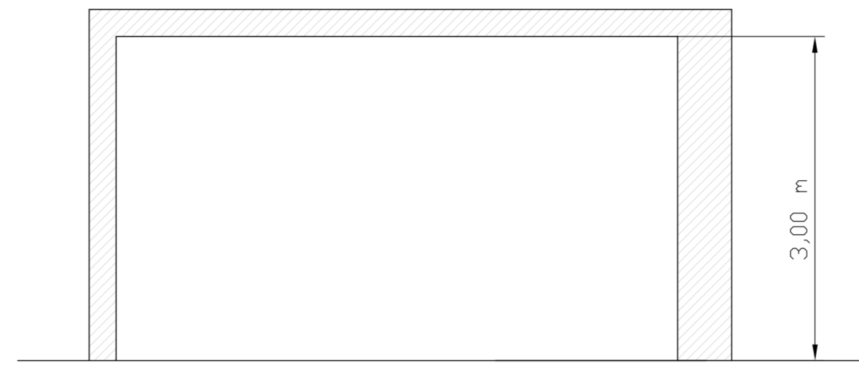
SEZIONE A-A LOCALE TECNICO - SCALA 1:50