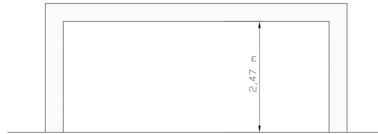
SEZIONE A-A LOCALE CENTRALE TERMICA - SCALA 1:50