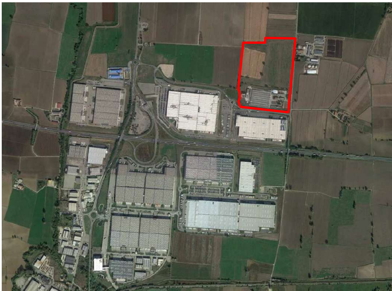
Vista aerea complessiva del Parco Logistico