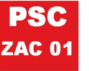
Tavola di sintesi della classificazione acustica